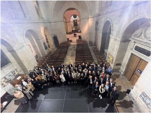
Photographie 6 : Chapelle Saint Louis de la Salpêtrière

Le réseau POLA remercie l'ensemble des partenaires pour leur soutien dans l'organisation et la réussite ce colloque.