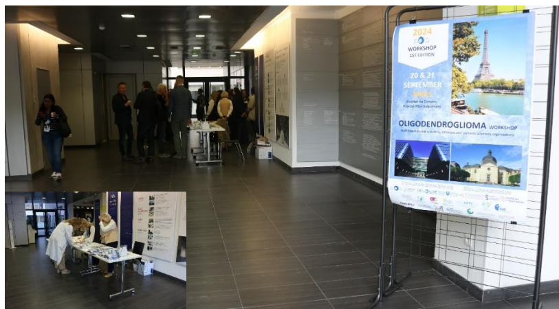
Photographie 1 : Accueil du workshop

C'est dans ce contexte, que le 1 er workshop du réseau sur les oligodendrogliomes s'est déroulé. Organisé sur 3 demi-journées, ce workshop a permis à la fois de faire un état des lieux des connaissances sur les tumeurs oligodendrogliales et de mettre en avant les travaux de recherche les plus innovants, d'illustrer l'importance de la structuration en réseau pour le développement d'une recherche de qualité à l'échelle nationale et de la confronter aux travaux d'équipes européennes et américaines avec une volonté d'initier de nouvelles collaborations et de nouvelles perspectives.